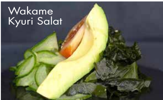
Wakame Kyuri Salat

CHF 10.50 Algen mit Gurken und Avocado Salat, hausgemachte Sauce